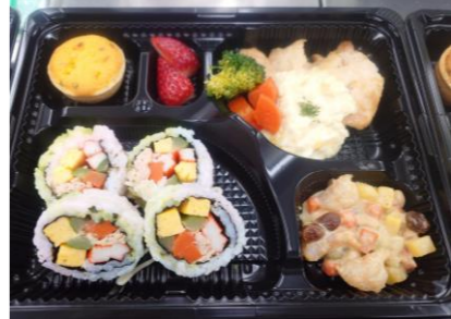
▲クリスマスイベントのお弁当。