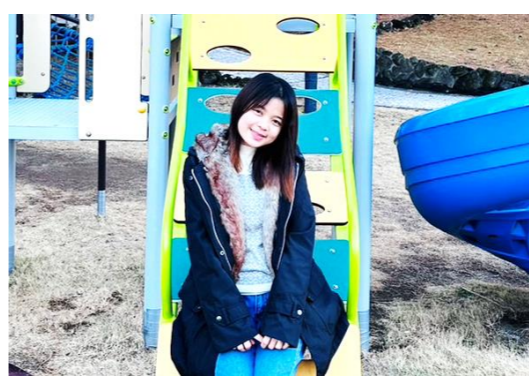
【旧棟 エー・モツモツさん】

ユニット棟で介護の仕事をして1年半になります。最初はわからないことが多く大変でしたが、今は慣れました。勤務は週3~4日で、月に5回夜勤がありますが、職員のみなさん優しくしてくれます。休みの日は一緒に暮らしているミャンマー人のみんなと遊んだり、海で泳いだりして楽しんでいます。新島の食べ物は明日葉が大好き!クサヤはにおいに慣れずいまだに食べられません(笑)