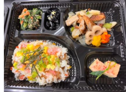
▲新年初回のちらし寿司とひら煮。