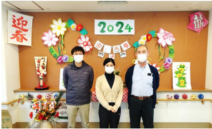
▲事務室3名です。現在事務員も募集中ですのでお気軽にお問合せください。

入職3年目の事務職員は「1番大変なのは利用者さんを直接ケアしている職員です。身体介護や夜勤など、日々頑張っている職員が働きやすいようにするのが事務の役割だと思っています。ケアする職員あつての私たちです。目立たない仕事ですが、島で唯一の福祉施設として地域を支えられていることにやりがいを感じています。」